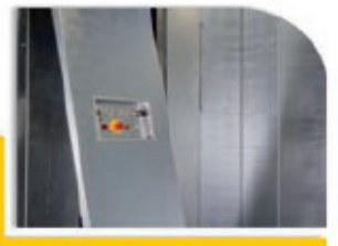
Plafón desmontable, para el mantenimiento desde el interior de la cabina.