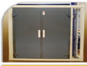
Puerta batiente manual de 1 o 2 hojas, con asidero enrasado interior. Ver Catálogo EH para más información.