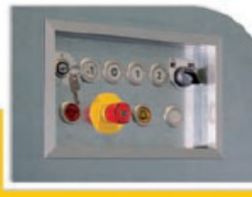
Botonera en cabina de pulsación constante, retranqueada y protegida por un marco para evitar daños en las operaciones de carga. Compuesta por: indicador pesacargas, llavín habilitador (con preferencia de uso), stop de emergencia, botón de alarma, luz de emergencia y selector luminoso para maniobra de antiderivas (opcional).