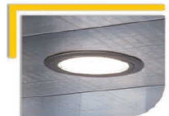
Luminaria en el techo.