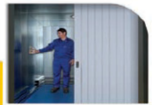
Puerta de lamas manual o automática, la mejor solución cuando se requiera dejar libre la zona de embarque. Puede utilizar el espacio existente entre las guías y la pared del hueco. Lamas de alta resistencia gracias al grosor de 40mm. Paso Libre entre 1200 y 3000mm y Altura Libre entre 2000 y 2500mm. Para más información, consultar Especificaciones Técnicas.