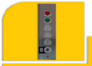
Botonera en planta de llamada y envío con llavín habilitador, indicador de presencia en planta y empotrada en el marco.