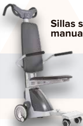
Sillas salvaescaleras manuales

Expertos en accesibilidad y eliminación de barreras arquitectónicas