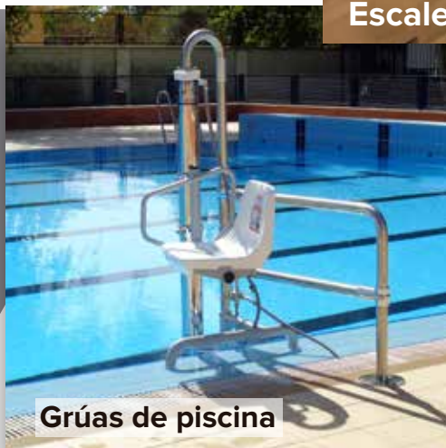
Grúas de piscina